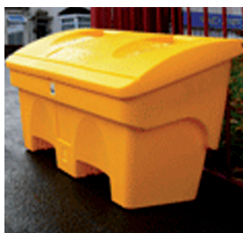
KAT.BR. - 00183