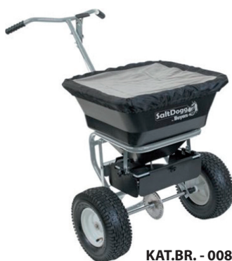
KAT.BR. - 00850