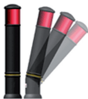
KAT.BR. - 00182